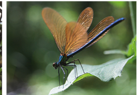
Le Calopteryx vierge