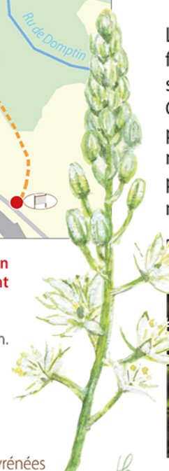
Le Lioriot d'Europe