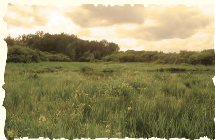
1989 Premier site contractualisé : la Vallée d'Acon à La Chaussée-Tirancourt (SOMME)