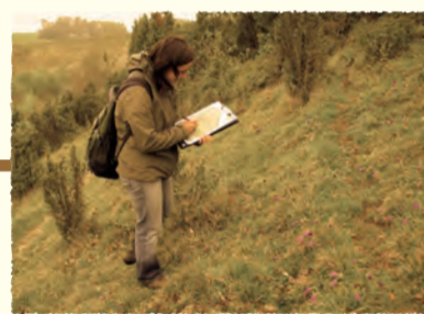
Suivi scientifique Bouchon (SOMME)