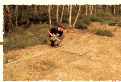
Suivi scientifique Versigny (AISNE)