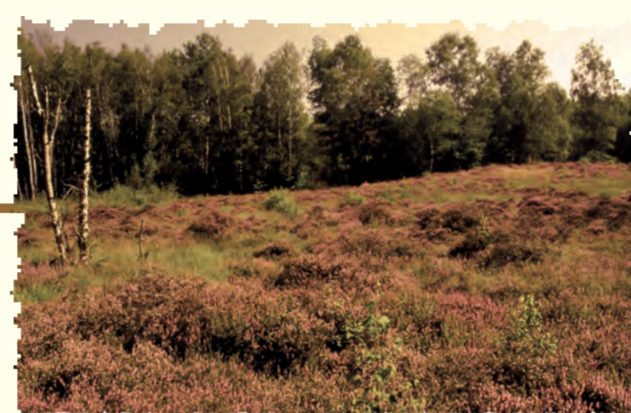
1996 La Réserve Naturelle Nationale de Versigny (AISNE)