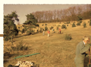
Chantier nature Fignières (SOMME)