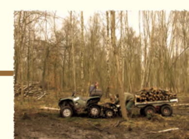
Transport en quad d'une remorque chargée Parfondru (AISNE)