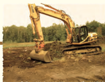
Etrépage Versigny (AISNE)