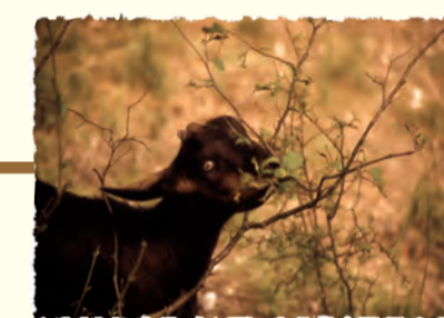
Pâturage caprin Eclusier-Vaux (SOMME)