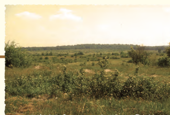
2005 Le camp de Sissonne (AISNE)