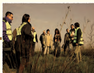
Concertation Conseil Général de l'Aisne Monampteuil (AISNE)