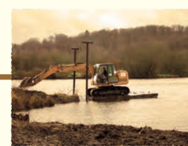
Transfert d'une pelle sur un îlot en vue d'un dessouchage de saulaie Belloy-sur-Somme (SOMME)