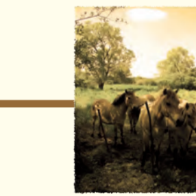
Pâturage de chevaux La Chaussée-Tirancourt (SOMME)