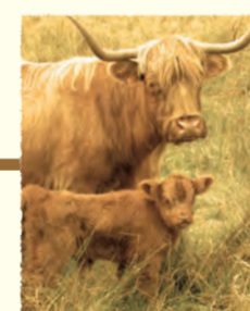
Pâturage de Highland Cattle Saint-Germer-de-Fly (OISE)