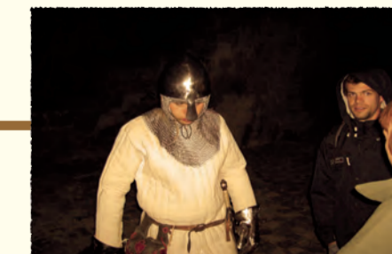
2008 Congrès des Conservatoires d'espaces naturels (Soirée méditerranéenne à Coucy-le-Château - AISNE)