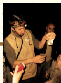
Sortie Nature Beauvais (OISE)