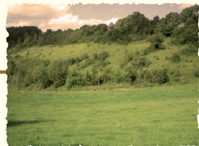
1991 La Réserve Naturelle Volontaire du Larris de Saint-Pierre-Es-Champs (OISE)