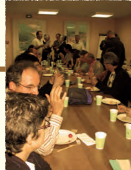
2004 et 2007 Création de l'antenne de l'Aisne et de l'Oise (Réunion des Conservateurs bénévoles - Beauvais - OISE)