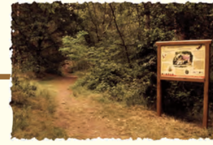
Aménagements pour l'accueil du public Péroy-les-Gombries (OISE)