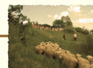
Arrivée des moutons Bailloul-sur-Thérain (OISE)