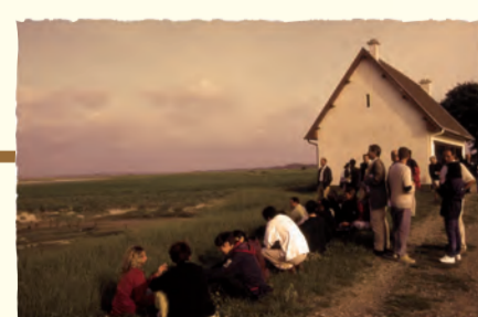
2002 Séminaire des Conservatoires d'espaces naturels à Amiens (SOMME)