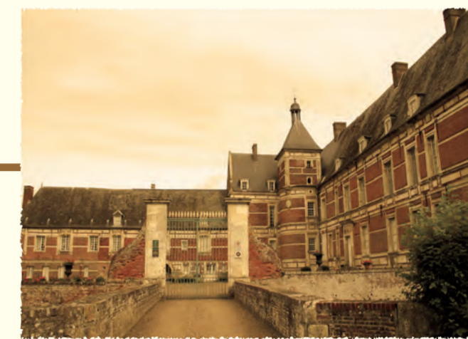
2007 Le château de Troisereux (OISE) (Protection des chiroptères)