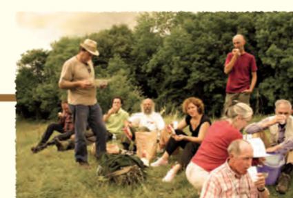
2006 Réunion des Conservateurs bénévoles