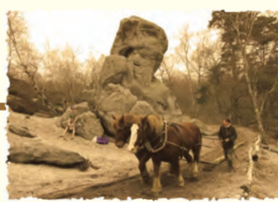
Débardage à cheval Coigny (AISNE)