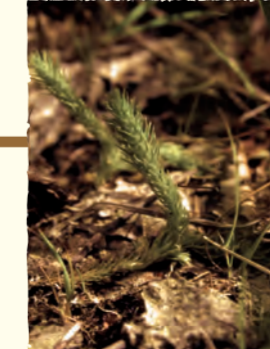
2008 Retour du Lycopode sur la Réserve Naturelle Nationale de Versigny (AISNE)