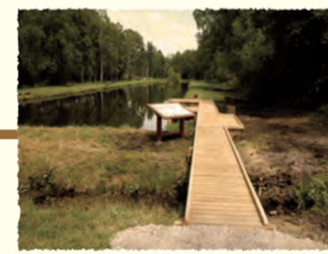
Aménagements pour l'accueil du public Liesse-Notre-Dame (AISNE)