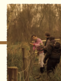
Pose de clôture Chantier nature Pierrepont (AISNE)