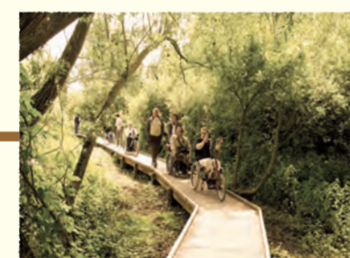
Aménagements tout handicapé Boves (SOMME)