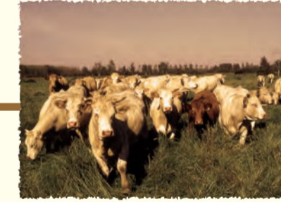
Pâturage par des Charolaises Marais de Renty Chivres-en-Laonnois (AISNE)