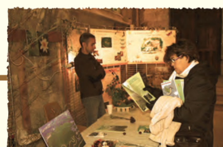
Stand du Conservatoire Présentation des sites et des activités