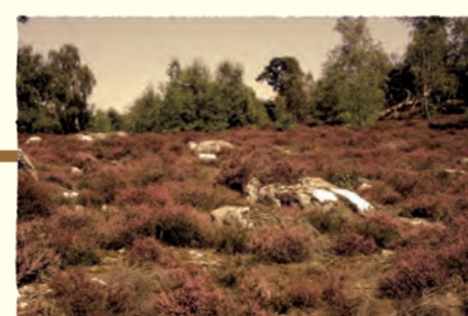
2006 Signature d'une convention avec le Parc naturel régional Oise-Pays de France (Landes de Phailly)