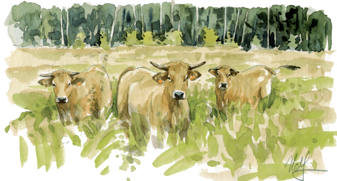
Le pâturage par des vaches de race "Nantaise" permet d'entretenir les prairies humides. Les marais gérés par le Conservatoire tout au long de la vallée de la Somme, se prêtent bien au pâturage par ces "Nantaises" adaptées aux zones humides. Menacée d'extinction à la fin des années 1980, la race est aujourd'hui sauvée.