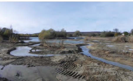
T. CHEVREZY / CEN Picardie