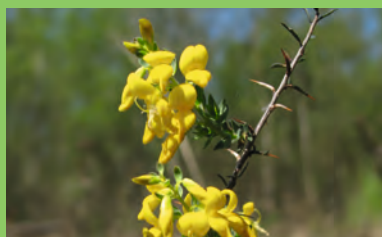
Le Genêt d'Angleterre ( Genista anglica )

Connu sur 2 autres sites de la Vallée d'Ardon (02) où il bénéficie de la gestion conservatoire, le Genêt d'Angleterre est réapparu en 2015 sur la tourbière de Laval-en-Laonnois. Les travaux engagés depuis 2013 pour la restauration de landes et autres habitats ouverts ont permis à cette plante menacée d'extinction de retrouver des conditions propices à son développement après plus de 100 ans d'absence. D'autres résultats positifs de ces travaux : la réapparition de la Rossolis à feuilles rondes, la floraison de la Linaigrette à feuilles étroites, le développement de plusieurs centaines de pieds de Bruyères à quatre angles