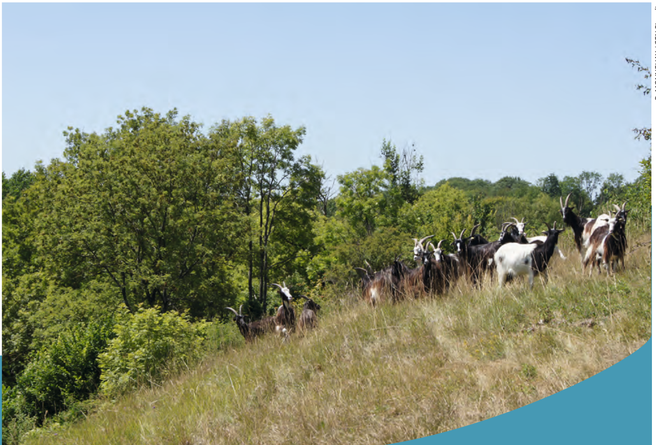
R. MONNEHAY / CEN Picardie

Chaque animal intervient différemment sur la végétation. Les chèvres sont friandes d'arbustes et de broussailles ; elles mangent les bourgeons, les jeunes feuilles et les écorces et limitent ainsi leur développement et maintiennent les paysages ouverts.