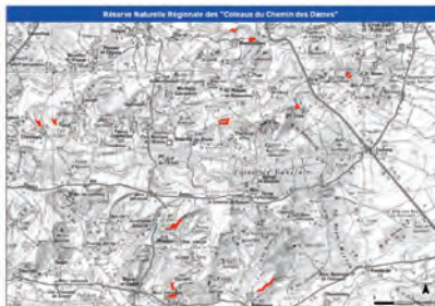
La RNR des Coteaux du Chemin des Dames et ses dix sites naturels

Gérée par le Conservatoire et la Communauté de Communes du Chemin des Dames, cette réserve permettra d'engager et poursuivre différentes actions avec les propriétaires et acteurs locaux en faveur du patrimoine de ce territoire.