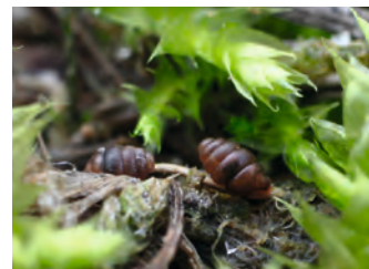
D. TOP / CEN Picardie

Pour les curieux de nature, des sorties accompagnées d'un animateur nature du Conservatoire de Picardie permettent de découvrir les richesses cachées du site. Retrouvez les dates de ces activités nature sur : www.conservatoirepicardie.org .