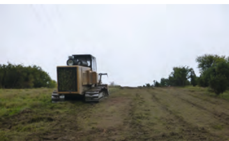
P. TRONGNEUX / CEN Picardie