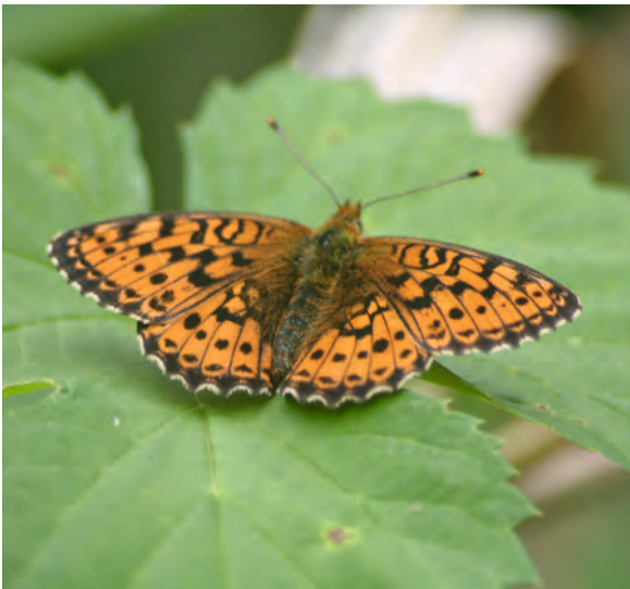
Le Nacré de la Sanguisorbe