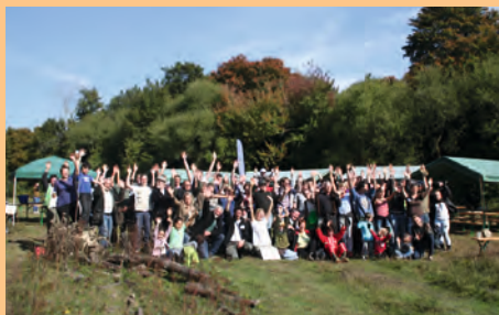
La bonne humeur était au rendez-vous au Chantier nature du Fond-Mont-Joye