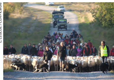
La Transhumance de Sissonne

C'est ainsi qu'au petit matin, après cinq mois de pâturage sur le camp, les 350 moutons ont quitté leur estive pour rejoindre la bergerie où ils passeront l'hiver. Enfin arrivé à Montloué, après avoir parcouru les 22 kilomètres, les brebis ont pu retrouver leur pâturage d'automne, et c'est dans la cour et la bergerie de l'exploitation du GAEC Gosset qu'a eu lieu la suite des festivités avec un marché du terroir accompagné d'un méchoui. Cette belle journée s'est terminée en musique par un spectacle de la « Compagnie Patrick Cosnet » réinterprétant le répertoire de Pierre Perret.