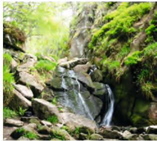
La cascade du Vat

Pour découvrir la réserve, 4 sentiers vous mèneront à travers la