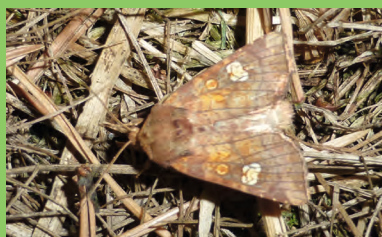
La Noctuelle éclatante ( Amphipoea oculata )

Connu sur 2 autres sites de la Vallée d'Ardon (02) où il bénéficie de la gestion conservatoire, le Genêt d'Angleterre est réapparu en 2015 sur la tourbière de Laval-en-Laonnois. Les travaux engagés depuis 2013 pour la restauration de landes et autres habitats ouverts ont permis à cette plante menacée d'extinction de retrouver des conditions propices à son développement après plus de 100 ans d'absence. D'autres résultats positifs de ces travaux : la réapparition de la Rossolis à feuilles rondes, la floraison de la Linaigrette à feuilles étroites, le développement de plusieurs centaines de pieds de Bruyères à quatre angles