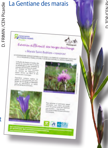
D. TOP / CEN Picardie