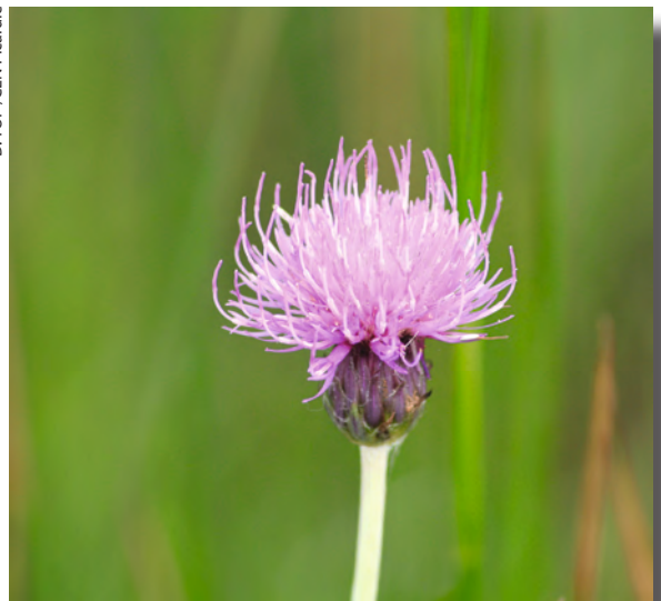
Le Cirse des anglais