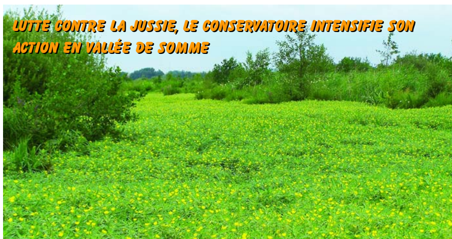
LUTTE CONTRE LA JUSSIE, LE CONSERVATOIRE INTENSIFIE SON ACTION EN VALLÉE DE SOMME