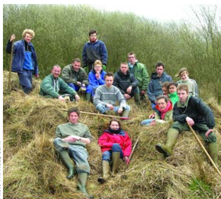
Quelques élèves du CFPPA D'Airion à St Germer-de-Fly

Depuis plusieurs années le Conservatoire travaille aussi en collaboration avec le LEGTA