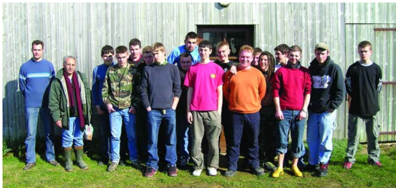
Quelques élèves du Lycée Forestier de Bavay à l'occasion d'un chantier au Plessier-sur-Bulles

Depuis de nombreuses années déjà de multiples partenariats ont pu voir le jour entre des établissements d'enseignement agricole et le Conservatoire des sites naturels de Picardie. Par la participation aux activités de gestion des sites naturels, par des initiations ou encore par la gestion d'un troupeau de vaches nantaises... l'objectif du Conservatoire reste le même : sensibiliser les futurs agriculteurs et professionnels du milieu rural à la protection et à la gestion des espaces naturels. Nous avons souhaité vous présenter ici quelques exemples pour valoriser ces initiatives constructives pour les milieux naturels.