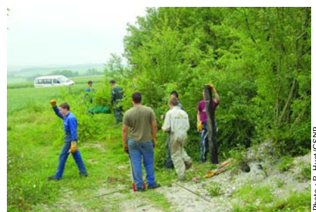
CFPA de Rouvroy-les-Merles, pose de clôture à Paillart

Bien qu'il n'y ait pas un lien évident entre les actions du Conservatoire et la formation de machinisme agricole mise en œuvre au CFPA de Rouvroy-les-Merles, la direction a ainsi souhaité engager les élèves dans des projets parallèles à caractère de culture générale.