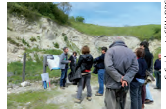
La forteresse se visite à la belle saison

Pour préparer votre visite, consultez le site Internet de la forteresse : www.mimoyecques.com