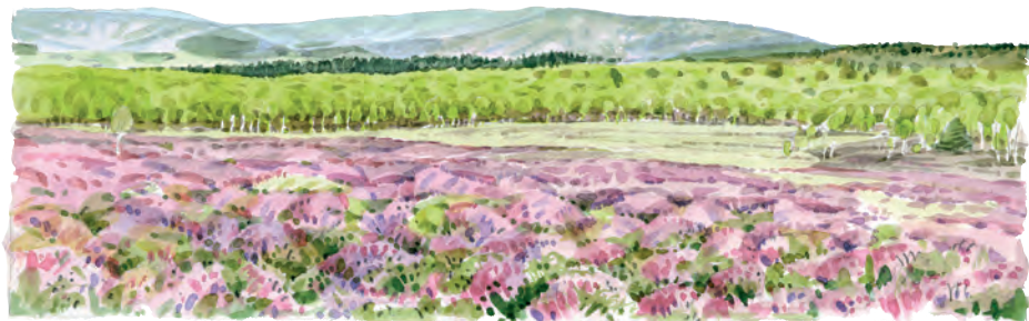
La Réserve du Muir of Dinnet présente des paysages semblables à la Réserve de Versigny (illustration : N. De Faveri)

marquables d'Ecosse et travailler à un projet de jumelage entre la RNN des landes de Versigny et la Réserve du Muir of Dinnet. Un projet qui se concrétisera dès cet automne.