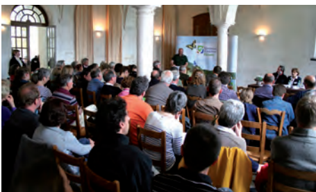
R. MONNEHAY / CEN Picardie