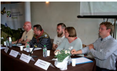
R. MONNEHAY / CEN Picardie

En marge du rendez-vous, des sorties nature étaient organisées au marais du Pendé mais également sur la Dune du Royon (à Fort-Mahon) par le Syndicat Mixte Baie de Somme Grand Littoral Picard ainsi qu'au Marais du Haut-Pont à Douriez (Pas-de-Calais) par le Conservatoire du Nord-Pas de Calais.