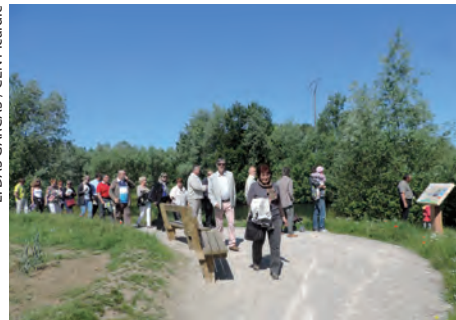
Le nouveau sentier du site du Plessis-Brion