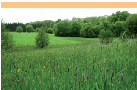
A. MESSEAN / CEN Picardie