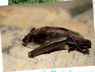
Le Murin des marais