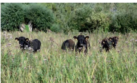
D. ADAM / CEN Picardie