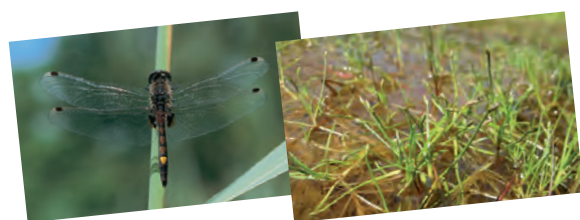
La Leucorrhine à gros thorax Le Scirpe flottant

Après de gros travaux de déboisement et d'étrepage (opération permettant de faire réapparaître de jeunes plantes dites pionnières parmi d'autres vieillissantes ou encore de retrouver des espèces disparues en surface mais dont les graines sont encore présentes dans la couche inférieure du sol), la réserve est entrée dans une phase d'entretien grâce notamment au pâturage de moutons et de vaches. Restait encore à restaurer la carrière géologique ! Dans le cadre de la valorisation