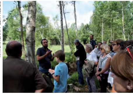
Visite du site de Lavilletterre lors de l'inauguration du panneau d'accueil