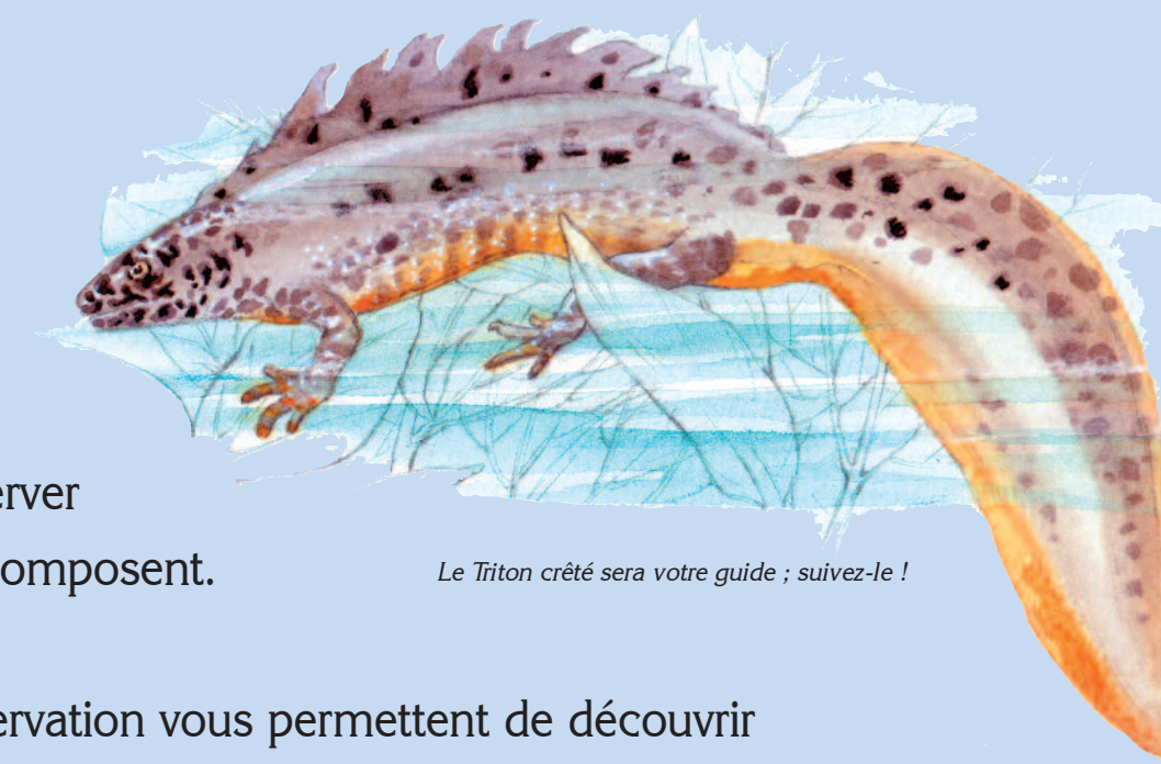
Le Triton crêté sera votre guide ; suivez-le !