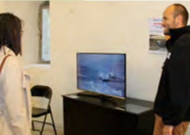
Une scénographie inédite