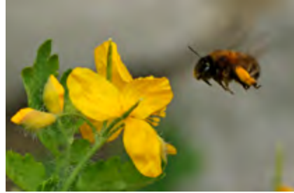
Abeille sauvage ( Anthophora plumipes )

Vous souhaitez devenir un observateur bénévole ? Contactez-nous au 03 21 54 75 00 !