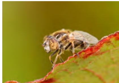
Syrphe ( Eristalinus sepulchralis )

Les syrphes (ou Syrphidés) sont une famille de Diptères (mouches), distinguables des abeilles par leurs antennes courtes. Elles sont le plus souvent mimétiques de certaines espèces d'hyménoptères de par leurs formes et leurs couleurs. Beaucoup ressemblent ainsi à s'y méprendre aux abeilles sauvages. Les syrphes adultes se nourrissent essentiellement du nectar des fleurs, alors que leurs larves sont commensales ou souvent prédatrices.