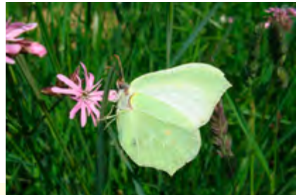
Papillon ( Gonopterix thamni )

Les papillons (ou Lépidoptères) représentent sans doute les insectes pollinisateurs les plus connus et appréciés du grand public. Parmi eux, on peut distinguer les papillons de jour (ou Rhopalocères), et les papillons dits de nuit (ou Hétérocères), même si bon nombre d'entre eux butinent tout de même le jour. La caractéristique distinguant le plus les papillons des autres insectes pollinisateurs est leur trompe. Cet appendice buccal très long et agile est parfaitement adapté à la récolte du nectar des fleurs.