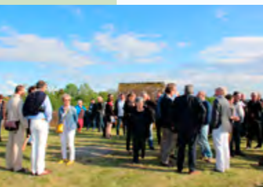
Un vernissage réussi