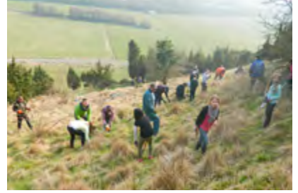
Rejoignez-nous sur un chantier nature

Le bénévolat, élément essentiel du fonctionnement du Conservatoire reste pourtant mal connu et peu visible. La valorisation du bénévolat donne une image plus fidèle de l'activité, du dynamisme et de l'engagement des membres du Conservatoire. Valoriser l'engagement des bénévoles, c'est affirmer leur importance dans la réalisation du projet associatif. Dans ce but, l'équipe du Conservatoire développe des outils comme la charte du bénévolat ou la fiche de suivi des heures de bénévolat. Le Conservatoire a également pour ambition de créer une synergie entre les membres (groupes thématiques, portes ouvertes...).