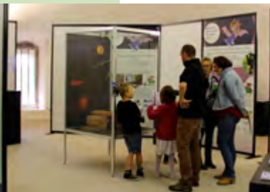
Une exposition ludique