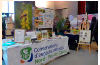
Animez des stands pour faire connaître le CEN