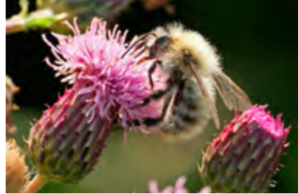
Bourdon ( Bombus pascuorum )

Les abeilles sauvages et les bourdons présentent une incroyable diversité de formes, de couleurs et de tailles. On estime qu'il y a entre 350 et 400 espèces d'abeilles sauvages dans la région transfrontalière. Il s'agit d'espèces sociales (ex : les bourdons) ou solitaires (qui élèvent seules leur progéniture). Elles se nourrissent essentiellement de pollen et de nectar et possèdent des structures spécialisées de récolte du pollen (brosses, corbeilles, soies plumeuses...) faisant d'elles d'excellents pollinisateurs.