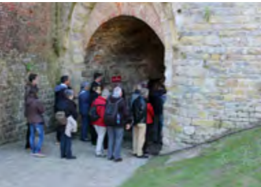
Des visiteurs conquis

Les chauves-souris, ces mammifères discrets virevoltant à la tombée de la nuit, ont trouvé à Montreuil-sur-Mer des conditions favorables à leur cycle de vie. Pourtant, elles restent méconnues du grand public et victimes de nombreuses idées reçues... Ainsi, lorsque le Conservatoire d'espaces naturels Nord Pas-de-Calais a proposé à ses partenaires locaux (Commune, Citadelle, CMNF, GDEAM62 puis CA2BM) de concevoir et mettre en place une exposition permanente consacrée aux chauves-souris au sein de la Citadelle, ces derniers se sont fortement mobilisés au côté du CEN pour mener à bien ce projet collaboratif.