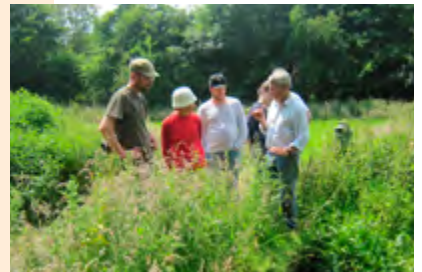
Devenez conservateur bénévole