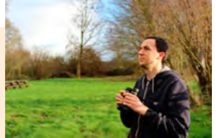
Participez à l'un de nos inventaires naturalistes