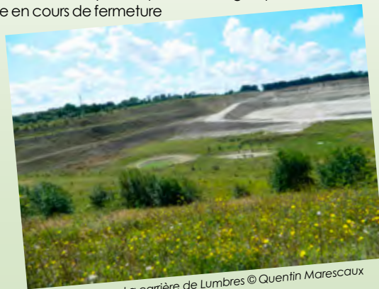
La carrière de Lumbres

Enfin, plusieurs acquisitions foncières viennent renforcer en cette fin d'année les périmètres de Réserves du Conservatoire à savoir RNN d'Acquin et Wavrans et 3 RNR (Baives, Dannes et Val de Sambre).