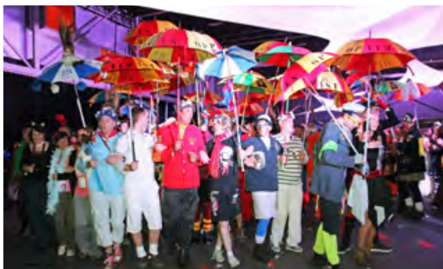
Congrès 2015 - Soirée carnaval