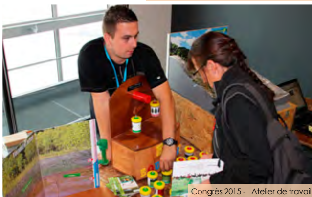
Congrès 2015 - Atelier de travail