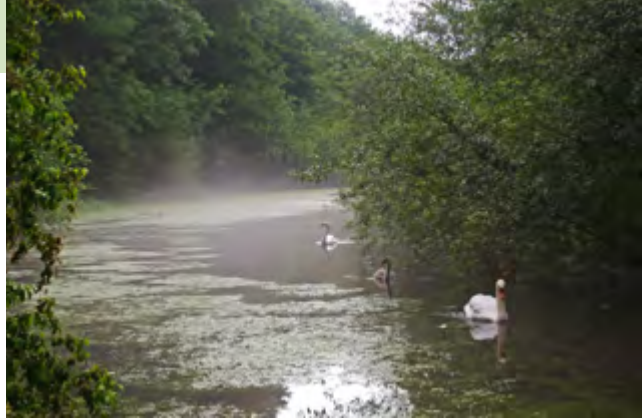
Marais de Marœuil