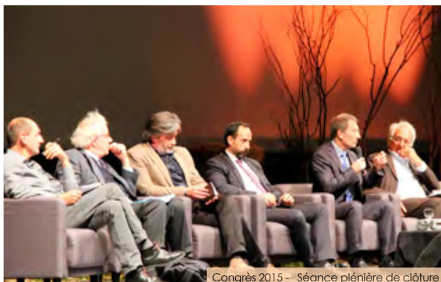
Congrès 2015 - Séance plénière de clôture