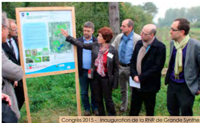
Congrès 2015 - Inauguration de la RNR de Grande Synthèse