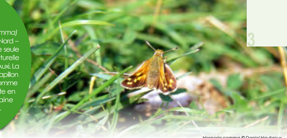
Hesperia comma

La Virgule ( Hesperia comma ) n'était connue dans le Nord – Pas-de-Calais que d'une seule localité : la réserve naturelle régionale de Noeux-les-Auxi. La population de ce petit papillon était déjà considérée comme peu abondante sur le site en 2006, avec une trentaine d'individus comptabilisés.