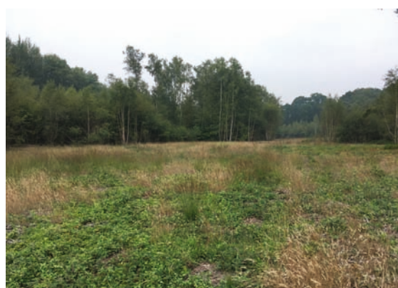
La clairière en été 2017