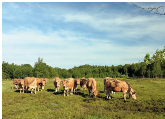
Le troupeau de bovin au travail

Le pâturage est réalisé grâce aux animaux de 2 éleveurs qui mettent à disposition chaque année leur troupeau pour entretenir ces milieux d'exception.