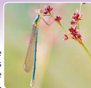
Le Leste sauvage

67 % de la communauté régionale de libellules et demoiselles (41 espèces sur la réserve pour un total régional de 61).