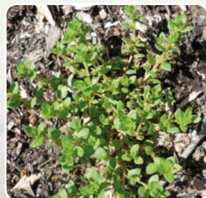
La Centenille naine

2 pieds entre 2008 et 2010 75 pieds en 2016