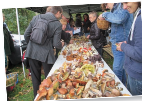
A la découverte des champignons

Chaque année, au moins trois sorties nature sont réalisées pour découvrir ou redécouvrir le patrimoine de la réserve. Vous trouverez ces sorties sur le calendrier nature du Conservatoire d'espaces naturels de Picardie ou sur le site du Conservatoire : www.conservatoirepicardie.org .