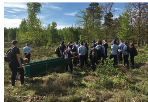
Les jeunes de l'EPIDE de Saint-Quentin

Le Conservatoire travaille depuis plusieurs années avec l'Epide de Saint Quentin dont la mission est d'accompagner les jeunes de 18 à 25 ans, sortis du système scolaire, en vue de leur insertion durable dans la société. Cet établissement public réalise plusieurs chantiers nature sur la réserve. Fin mai, lors d'une intervention, les journalistes de France 3 Picardie et l'Aisne nouvelle sont venus à leur rencontre mettre en avant le travail partenarial réalisé avec le Conservatoire.