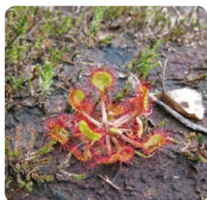
La Rossolis à feuilles rondes

Depuis 20 ans, de nombreux suivis et études ont été réalisés. Voici quelques exemples de l'évolution des effectifs d'espèces suite aux travaux menés :