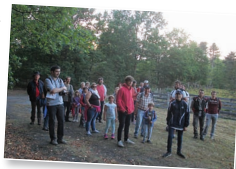
Les participants à la sortie «Versigny la nuit»