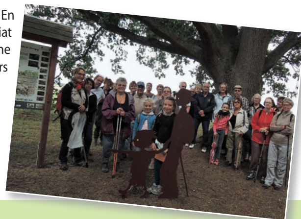
Sortie nature avec la Médiathèque de Tergnier

L'exposition sur la réserve a été installée tout l'été à la médiathèque de Tergnier. En complément, le Conservatoire a organisé deux sorties découverte en partenariat avec cette dernière, réunissant pour chacune une trentaine de personnes. Une bonne manière de faire découvrir le patrimoine remarquable du site aux usagers du territoire.