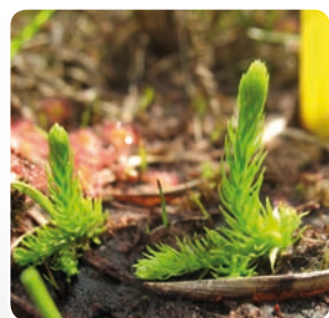
Le Lycopode des sols inondés

37 pieds entre 2008 et 2010 765 pieds en 2016