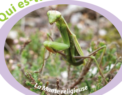
La Mante religieuse