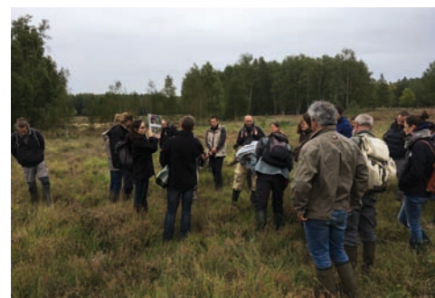
Journée d'échanges techniques

Le 13 septembre dernier, le Conservatoire et la DREAL des Hauts-de-France ont organisé un atelier à l'occasion des 20 ans de gestion de la réserve. Il avait pour objectif de présenter, sous forme de retour d'expériences, les différents travaux de restauration et d'entretien (déboisement, étrépage, fauche exportatrice, pâturage) menés sur le site. Une quarantaine de participants avait répondu présent pour cette journée divisée en deux temps, la matinée à la salle des fêtes et l'après-midi en extérieur sur la réserve.