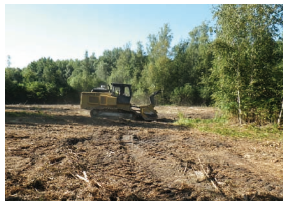
Restauration de la clairière en septembre 2016

La réserve est aussi un très bon support pour permettre aux futurs spécialistes d'apprendre la mise en place de suivis naturalistes et découvrir des espèces emblématiques des milieux de lande. Les BTS utilisent également ces lieux pour concevoir et animer des sorties scolaires avec des primaires.