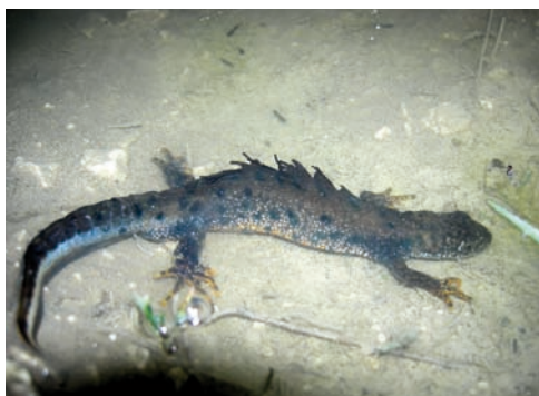
Le Triton crêté

Un contrat Natura 2000 avait été déposé en 2016 pour la restauration de 5 mares intra forestières en faveur notamment du Triton crêté et de la Leucorrhine à gros thorax. Celui-ci a été validé par les services de l'État en cours d'année. Les travaux vont pouvoir débuter en début d'année 2018 à la fin de la saison de chasse.