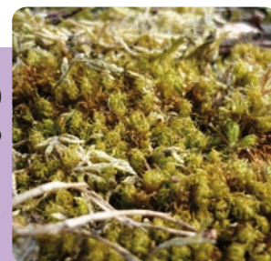
Le Dicrane bâtard