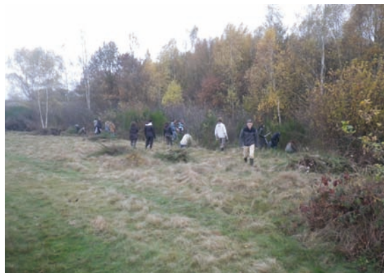
Les élèves de BTS lors d'un chantier nature