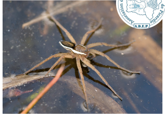
La Dolomède est emblématique de la réserve.