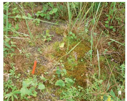
L'étrépage de la zone à Centenille et Radiole (en photos ci-dessus) réalisé dans le cadre d'un contrat Natura 2000 pourrait permettre le développement des deux espèces dès 2021.