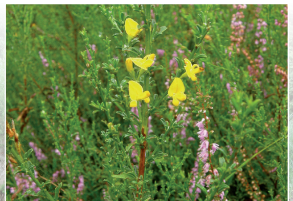
Le Genêt poilu

Le pied, jeune, présente 6 rameaux fleuris. Il peut être issu soit d'un ensemencement naturel depuis les pieds du site, soit de la reprise d'un vieux pied végétatif, en lien avec l'action de pâturage ovin sur le site qui permet de rajeunir la lande (création de trouées au sein de la callune).