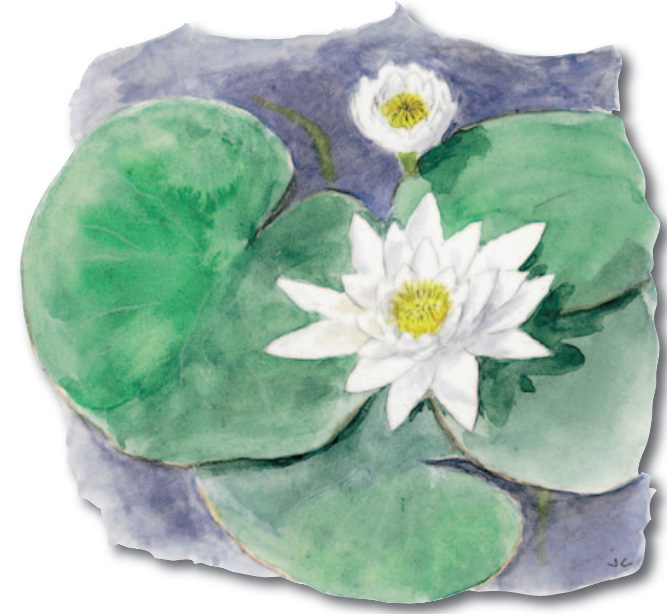
Le Nénuphar blanc

Une réserve naturelle est un espace naturel remarquable protégé légalement par décret interministériel pris en Conseil d'État. La réserve naturelle nationale de l'Étang-Saint-Ladre est créée en 1979 et dispose d'un règlement particulier propre à tout son territoire, qui couvre 13.5 hectares. Le Conservatoire d'espaces naturels des Hauts-de-France en est le gestionnaire. Afin de rendre accessible au plus grand nombre ce patrimoine naturel, un sentier de visite périphérique, équipé de bornes pédagogiques et d'un audioguide, a été aménagé.