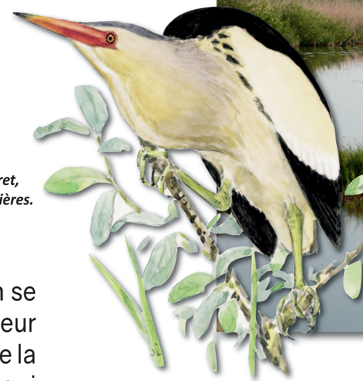
Le Blongios nain, oiseau rare et discret, fréquente les roselières.