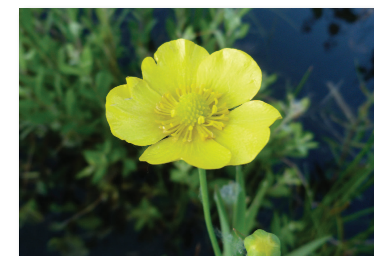
La Grande Douve