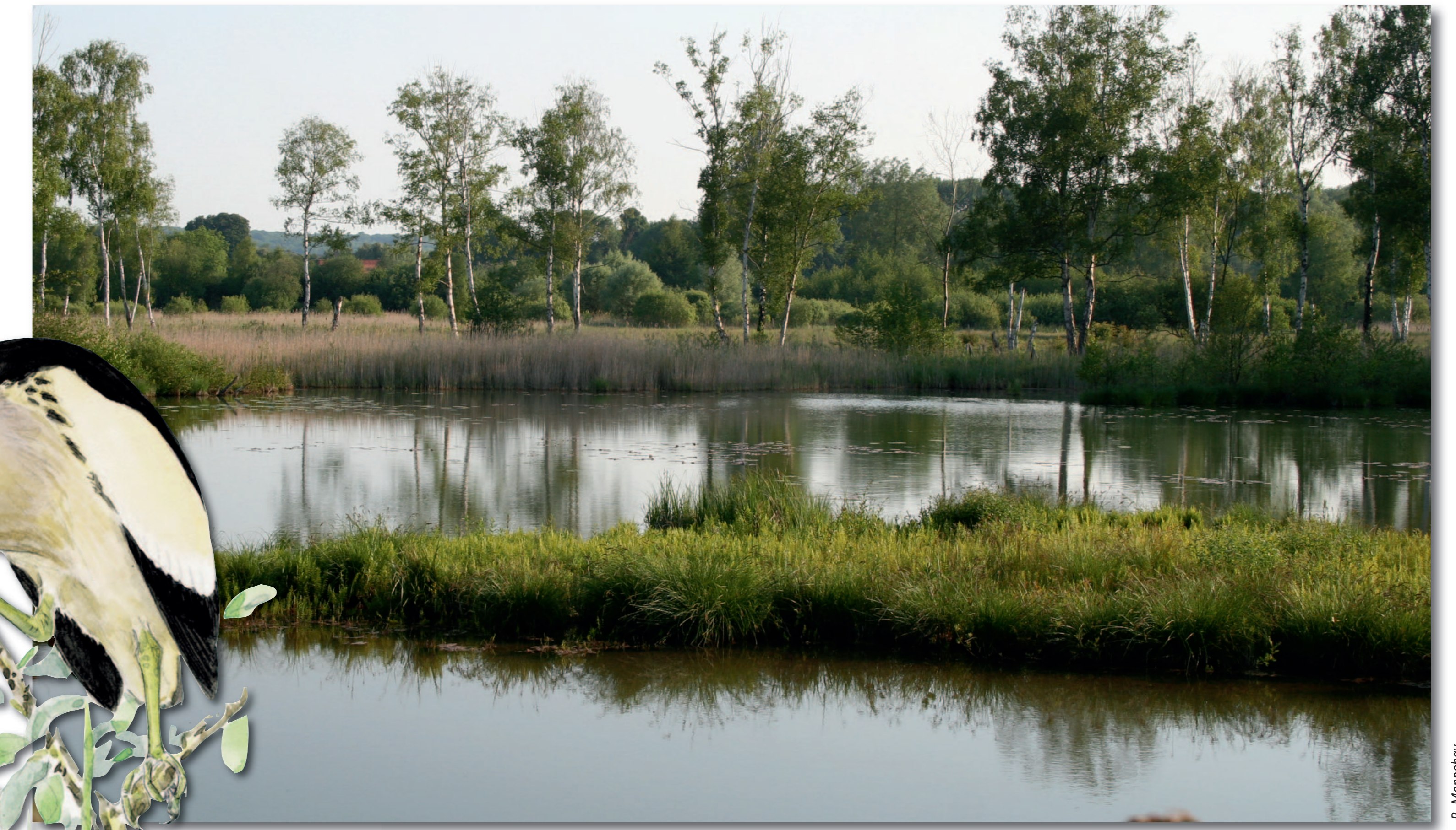
La mosaïque de milieux naturels (prairies, roselières, tremblants et pièces d'eau) est le résultat d'anciennes activités humaines liées au marais.