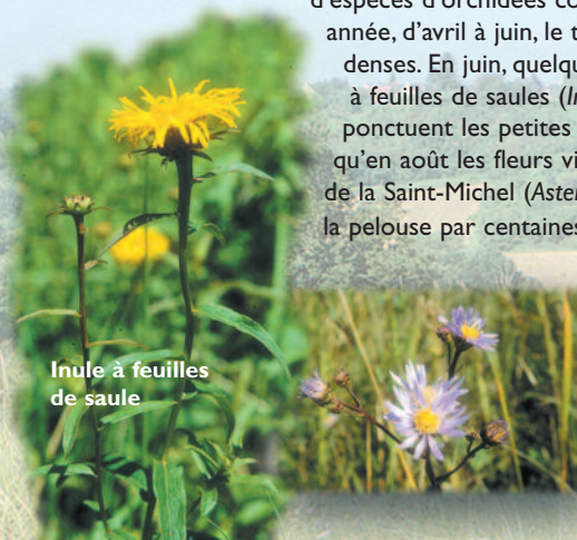
Inule à feuilles de saule

Géologie et climatologie expliquent en partie la présence en ces lieux d'un cortège exceptionnel de plantes sauvages. 191 espèces ont été recensées en l'an 2000. Une quinzaine d'espèces d'orchidées colorent chaque année, d'avril à juin, le tapis d'herbes denses. En juin, quelques massifs d'Inule à feuilles de saules ( Inula salicina ) ponctuent les petites buttes tandis qu'en août les fleurs violettes d'Aster de la Saint-Michel ( Aster amellus ) couvrent la pelouse par centaines.