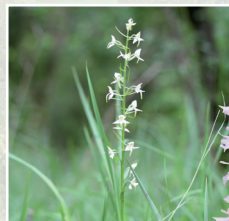
Plathantère à deux feuilles