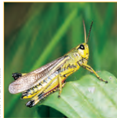
Le Criquet ensanglanté, insecte rare et menacé, est une remarquable illustration de la richesse faunistique des prairies pâturées.

Grâce au pâturage, les prairies sont très riches en sauterelles et en criquets.