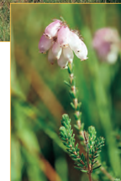
La Bruyère à quatre angles est caractéristique des landes humides. Rare et protégée, elle constitue des "tapis" de couleur rose bien visibles sur les secteurs de landes.

Les plantes intéressantes sont toutes liées à la présence d'un sol acide et humide. Les conditions relativement difficiles du milieu (sol pauvre en éléments nutritifs, inondation une partie de l'année...) ne permettent qu'à une flore originale et adaptée de croître. Ces particularités expliquent la présence d'une quinzaine d'espèces rares ou exceptionnelles.