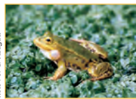
Les batraciens sont d'excellents indicateurs de la qualité des zones humides. Plusieurs espèces, dont la Grenouille verte, cohabitent sur le site.

La Turquoise, papillon remarquable de la famille des zygènes, profite des secteurs de prairies humides pour se reproduire. Les fossés et les cours d'eau ayant un léger courant accueillent le Caloptérix vierge, une délicate et rare libellule. La conservation du réseau de rus, fossés et point d'eau participent également au maintien du patrimoine naturel. Ainsi, pour renforcer ce maillage, 3 mares ont été creusées ces dernières années. Celles-ci ont rapidement été colonisées par diverses espèces de grand intérêt patrimonial tel que l'Agrion nain, libellule exceptionnelle en Picardie, ou le Triton crêté, amphibien en voie de raréfaction dans toute l'Europe. Au moins 54 espèces d'oiseaux ont été observées, dont la Bécasse des bois et la Bécassine des marais qui fréquentent le site une partie de l'année.