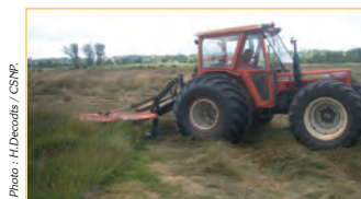
Le rajeunissement des prairies et des landes s'effectue notamment par une fauche mécanique.

Le site comprend de larges surfaces de pâtures ponctuées de secteurs de landes humides. Les landes se trouvent sur des sols pauvres et acides où vit une végétation constituée d'arbrisseaux bas comme les bruyères et les ajoncs. De par leur rareté dans le nord de la France, elles confèrent au site une grande importance pour la diversité biologique. Ces landes ne sont qu'une étape dans l'évolution spontanée des milieux et tendent, à long terme, à se boiser si aucun entretien ne vient les "rajeunir".