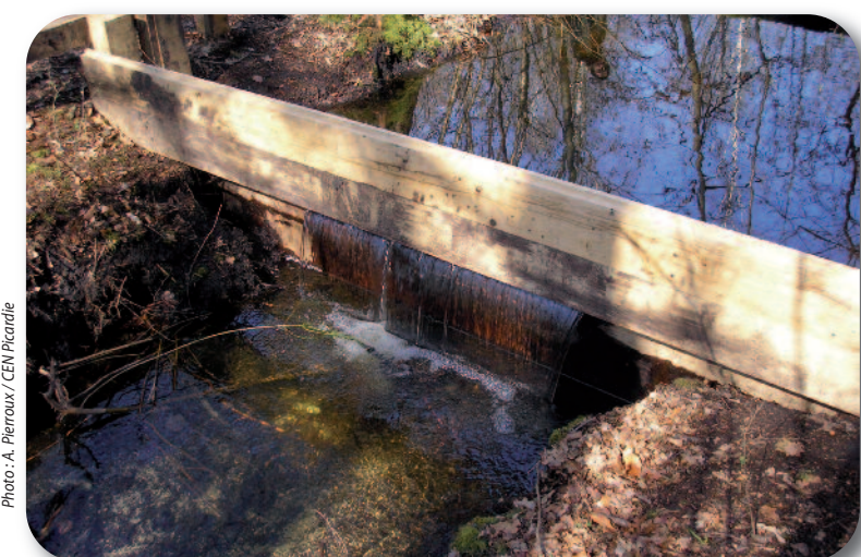
Les seuils retiennent l'eau sur le site pour éviter la minéralisation de la tourbe et la disparition des tremblants.

Le marais de Bourneville est un ensemble de 6 étangs situé en bordure du canal de l'Ourcq, en marge du Valois. Les étangs sont d'anciennes fosses de tourbage aux formes géométriques, issues de l'exploitation de la tourbe au début du XX e siècle. Suite à l'abandon de cette activité, et en l'absence d'entretien, le marais a peu à peu été reconquis par la végétation. Afin de conserver ses richesses naturelles, le site est aujourd'hui géré par le Conservatoire d'espaces naturels de Picardie.