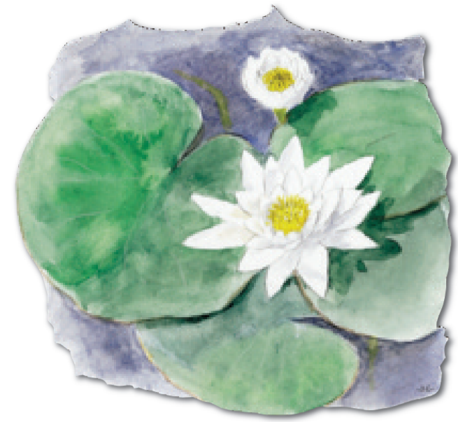
Le Nénuphar blanc

Une nature préservée aux portes d'Amiens