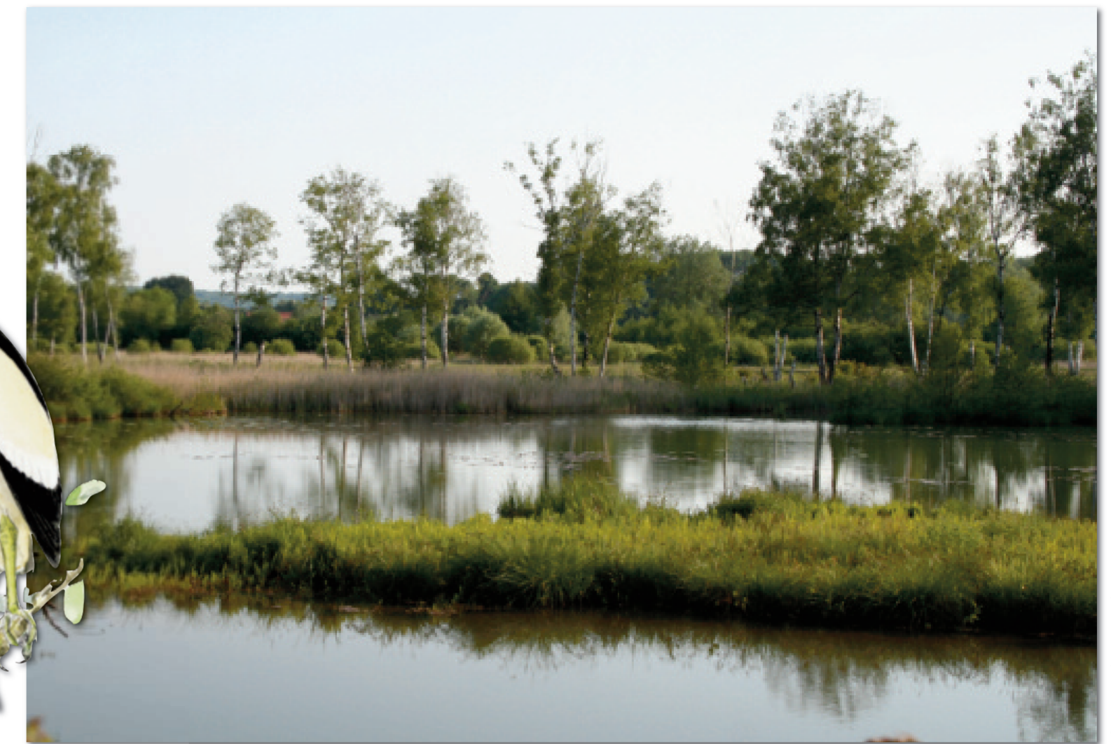
La mosaïque de milieux naturels (prairies, roselières, tremblants et pièces d'eau) est le résultat d'anciennes activités humaines liées au marais.

Le long du parcours, vous trouverez des bornes numérotées, représentées sur le plan ci-dessous. Elles renvoient vers le livret guide de la réserve naturelle, document disponible en mairie, auprès du Conservatoire d'espaces naturels de Picardie ou encore téléchargeable sur www.conservatoirepicardie.org