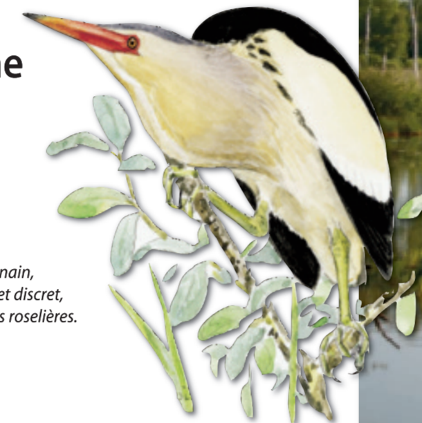
Le Blongios nain, oiseau rare et discret, fréquente les roselières.

Une réserve naturelle est un espace naturel de grand intérêt et protégé légalement par décret interministériel pris en Conseil d'Etat. La réserve naturelle nationale de l'Étang-Saint-Ladre a été créée en 1979 et dispose d'un règlement particulier propre à tout son territoire, qui couvre 13,5 hectares. Le Conservatoire d'espaces naturels de Picardie en est le gestionnaire. Afin de rendre accessible à tous ce patrimoine naturel, un sentier de visite périphérique, équipé de bornes pédagogiques et d'un audioguide, a été aménagé.