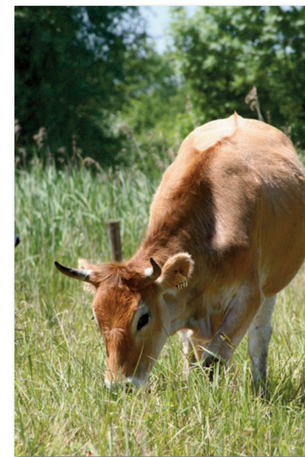
Les vaches nantaises entretiennent le marais durant une partie de l'année.

Dans un contexte profondément modifié par les activités humaines, la réserve fait figure d'exception écologique, heureusement insérée dans le complexe des marais tourbeux de la vallée de l'Avre. Le marais Saint-Ladre est justement classé en zone Natura 2000, c'est-à-dire reconnu au sein du réseau européen des écosystèmes naturels à protéger prioritairement. Ces zones humides sont aujourd'hui fragilisées par une réduction de leur surface globale et certaines entraves à leur fonctionnement naturel. Pourtant, beaucoup d'espèces, migratrices ou non, en dépendent. Rappelons-nous que ces marais nous sont aussi indispensables par les services qu'ils rendent, par exemple pour l'épuration de l'eau.